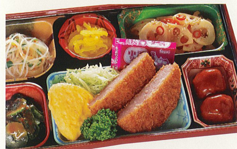
20 ソースハムカツ 熱量 475kcal タンパク質 15.3g 脂質 20.9g 炭水化物 52.4g 食塩相当量 3.9g 使用原料 卵 乳 小麦 そば 落花生 エビ カニ