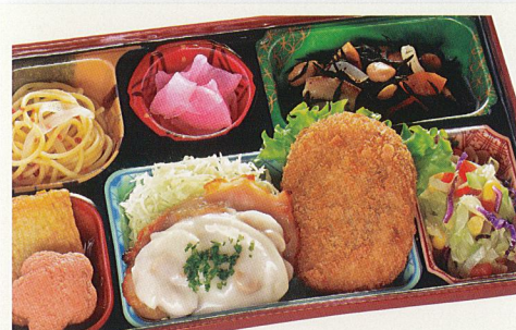
27 チキンのホワイトソース 熱量 430kcal タンパク質 15.3g 脂質 21.2g 炭水化物 39.8g 食塩相当量 3.8g 使用原料 卵 乳 小麦 そば 落花生 エビ カニ