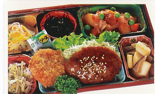
28 照り焼きハンバーグ 熱量 403kcal タンパク質 21.5g 脂質 12.5g 炭水化物 46.7g 食塩相当量 3.5g 使用原料 卵 乳 小麦 そば 落花生 エビ カニ