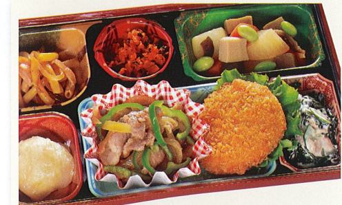
24 豚肉の生姜焼き 熱量 454kcal タンパク質 19.3g 脂質 25.7g 炭水化物 33.2g 食塩相当量 3.6g 使用原料 卵 乳 小麦 そば 落花生 エビ カニ