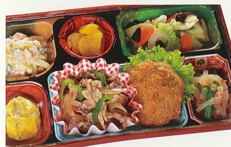
13 焼き肉・カレーコロッケ 熱量 545kcal タンパク質 16.3g 脂質 32.9g 炭水化物 43.5g 食塩相当量 3.4g 使用原料 卵 乳 小麦 そば 落花生 エビ カニ