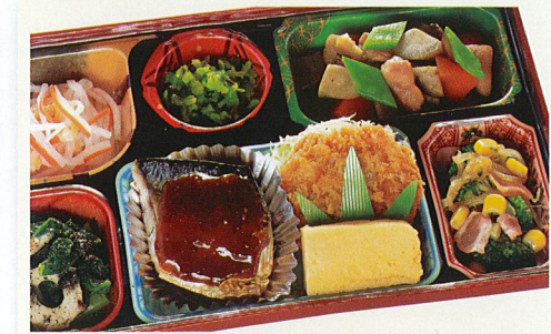
17 魚の味噌あんかけ 熱量 440kcal タンパク質 20.5g 脂質 19.7g 炭水化物 40.3g 食塩相当量 3.6g 使用原料 卵 乳 小麦 そば 落花生 エビ カニ