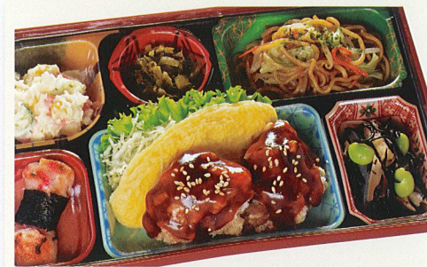
15 やみつきチキン・オムレツ 熱量 494kcal タンパク質 20.1g 脂質 27.2g 炭水化物 35.9g 食塩相当量 3.2g 使用原料 卵 乳 小麦 そば 落花生 エビ カニ