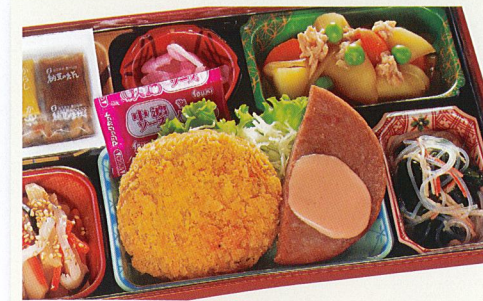
16 メンチカツ・ハムステーキ 熱量 462kcal タンパク質 17.1g 脂質 21.7g 炭水化物 39.5g 食塩相当量 3.9g 使用原料 卵 乳 小麦 そば 落花生 エビ カニ