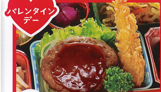
14 ハンバーグ&海老フライ 熱量 500kcal タンパク質 21.8g 脂質 18.8g 炭水化物 55.5g 食塩相当量 3.3g 使用原料 卵 乳 小麦 そば 落花生 エビ