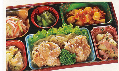
21 柚子風味の唐揚げ 熱量 476kcal タンパク質 22.2g 脂質 27.8g 炭水化物 28.5g 食塩相当量 3.9g 使用原料 卵 乳 小麦 そば 落花生 エビ カニ