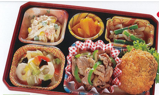
13 焼き肉 熱量 497kcal タンパク質 14.6g 脂質 31.0g 炭水化物 37.7g 食塩相当量 3.1g 使用原料 卵 乳 小麦 そば 落花生 エビ カニ