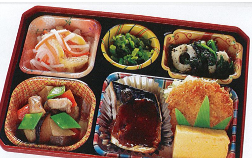
17 魚の味噌あんかけ 熱量 385kcal タンパク質 19.0g 脂質 15.6g 炭水化物 37.8g 食塩相当量 3.3g 使用原料 卵 乳 小麦 そば 落花生 エビ カニ