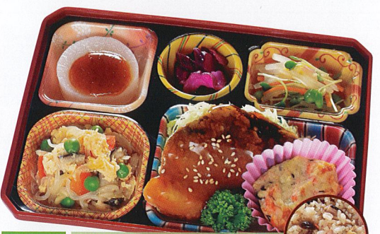
22 魚の蒲焼き風 炊き込みご飯 熱量 319kcal タンパク質 16.7g 脂質 12.2g 炭水化物 30.7g 食塩相当量 5.0g 使用原料 卵 乳 小麦 そば 落花生 エビ カニ