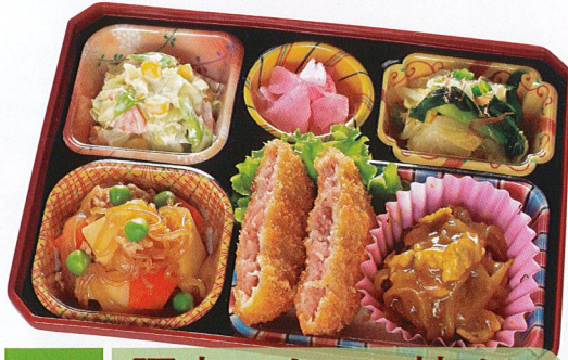
8 豚肉のカレー炒め

熱量 361kcal タンパク質 15.3g 脂質 17.3g 炭水化物 32.7g 食塩相当量 3.7g 使用原料 卵 乳 小麦 そば 落花生 エビ カニ