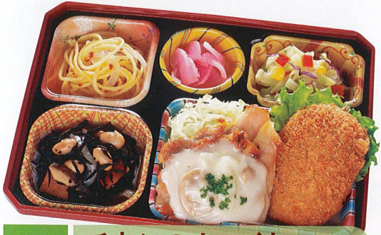
27 チキンのホワイトソース 熱量 376kcal タンパク質 12.7g 脂質 19.0g 炭水化物 34.2g 食塩相当量 3.0g 使用原料 卵 乳 小麦 そば 落花生 エビ カニ