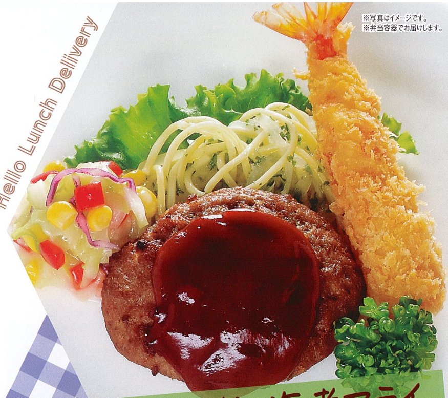
ハンバーグ&海老フライ