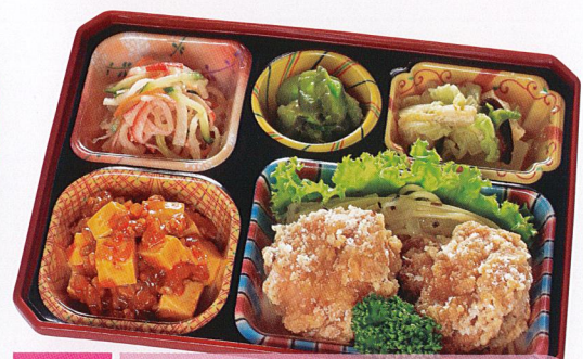
21 柚子風味の唐揚げ 熱量 416kcal タンパク質 21.1g 脂質 23.9g 炭水化物 24.8g 食塩相当量 3.6g 使用原料 卵 乳 小麦 そば 落花生 エビ カニ