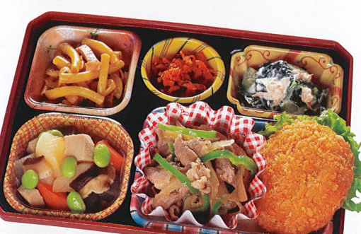
24 豚肉の生姜焼き 熱量 430kcal タンパク質 17.6g 脂質 24.7g 炭水化物 31.0g 食塩相当量 3.3g 使用原料 卵 乳 小麦 そば 落花生 エビ カニ