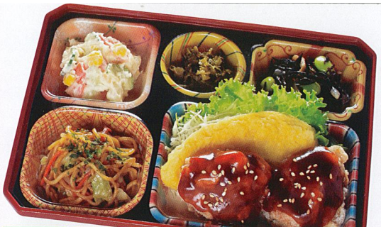
15 やみつきちキン 熱量 458kcal タンパク質 18.1g 脂質 26.8g 炭水化物 30.9g 食塩相当量 2.9g 使用原料 卵 乳 小麦 そば 落花生 エビ カニ