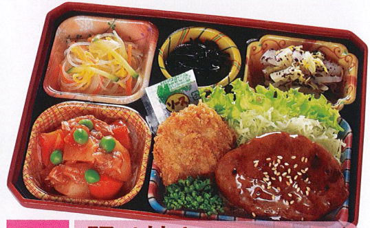
28 照り焼きハンバーグ 熱量 369kcal タンパク質 17.6g 脂質 12.2g 炭水化物 43.3g 食塩相当量 2.9g 使用原料 卵 乳 小麦 そば 落花生 エビ カニ