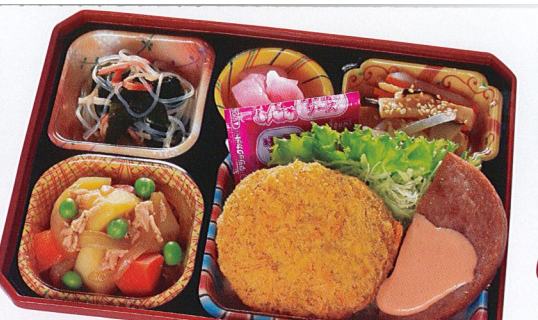
16 メンチカツ 熱量 413kcal タンパク質 13.1g 脂質 19.5g 炭水化物 36.1g 食塩相当量 3.9g 使用原料 卵 乳 小麦 そば 落花生 エビ カニ