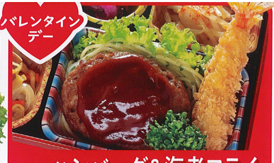
14 ハンバーグ&海老フライ 熱量 436kcal タンパク質 21.5g 脂質 17.9g 炭水化物 42.8g 食塩相当量 3.0g 使用原料 卵 乳 小麦 エビ