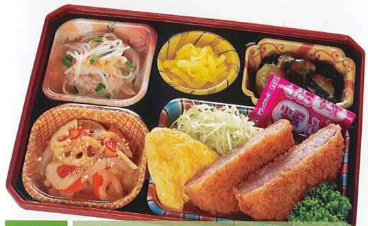
20 ソースハムカツ 熱量 417kcal タンパク質 11.9g 脂質 18.8g 炭水化物 46.2g 食塩相当量 3.2g 使用原料 卵 乳 小麦 そば 落花生 エビ カニ