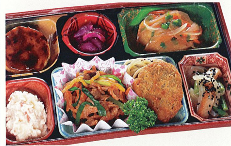
2 豚キムチ・ピーマン肉詰めフライ

熱量 411kcal タンパク質 15.6g 脂質 18.2g 炭水化物 41.7g 食塩相当量 3.2g 使用原料 卵 乳 小麦 そば なた 菜花 エビ カニ