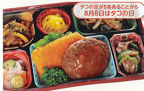
8 さわやかサルサソースハンバーグ

熱量 426kcal タンパク質 15.4g 脂質 17.1g 炭水化物 47.5g 食塩相当量 2.9g 使用原料 卵 乳 小麦 そば なた 菜花 エビ カニ