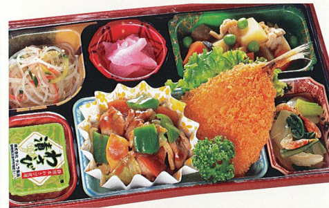
9 回鍋肉・魚のフライ

熱量 477kcal タンパク質 23.2g 脂質 21.1g 炭水化物 44.2g 食塩相当量 3.5g 使用原料 卵 乳 小麦 そば なた 菜花 エビ カニ