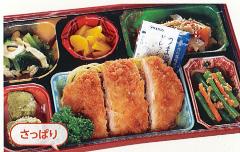
7 ドレッシングで食べるチキンカツ

熱量 436kcal タンパク質 22.7g 脂質 21.9g 炭水化物 51.6g 食塩相当量 4.5g 使用原料 卵 乳 小麦 そば なた 菜花 エビ カニ