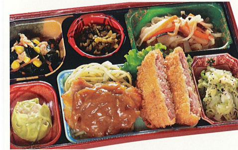
10 チキンのカレーソース

熱量 420kcal タンパク質 16.0g 脂質 20.3g 炭水化物 38.2g 食塩相当量 3.9g 使用原料 卵 乳 小麦 そば なた 菜花 エビ カニ