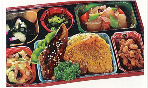
4 豚肉のパン粉焼き・魚の蒲焼き風

熱量 465kcal タンパク質 22.6g 脂質 25.3g 炭水化物 32.0g 食塩相当量 4.0g 使用原料 卵 乳 小麦 そば なた 菜花 エビ カニ